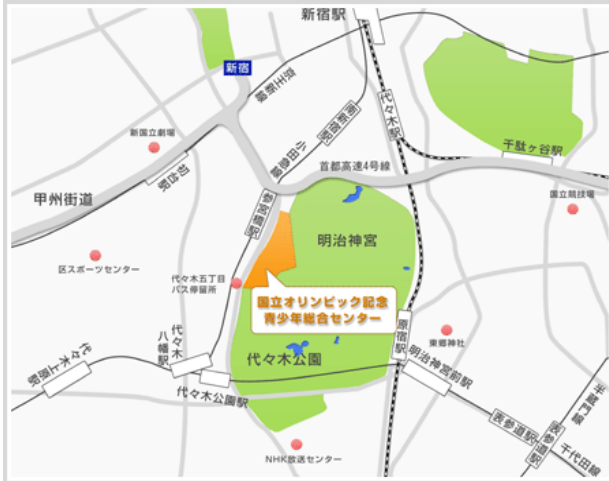
参宮橋駅から歩道橋を利用するルート