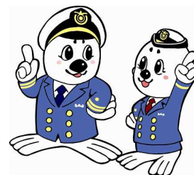
「うみまる」と「うーみん」