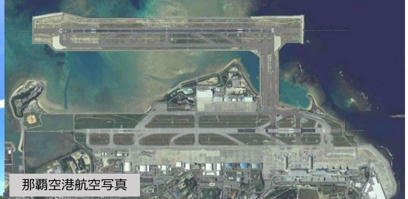
那覇空港航空写真

03 空港管理・運用の拠点となる庁舎・管制塔、航空保安施設を格納する局舎、空港の消火救難体制の要となる消防庁舎、維持作業用車両格納のための各種車庫等の様々な建築施設の営繕業務を主体としつつ、空港整備計画等の企画・立案、災害対策や空港周辺環境対策など幅広い業務を行っている。