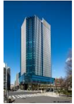
採用時勤務地(四ツ谷)

電話:03-5367-5025 (内線 122,123) URL: https://www.mlit.go.jp/jtsb/saiyou.html