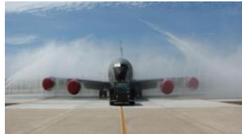
■嘉手納基地 大型洗機場