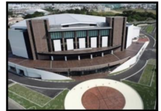
■沖縄アリーナ (再編推進事業)