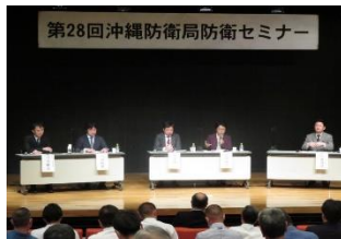
■防衛セミナー (防衛政策への理解を得る為のセミナー)