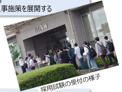
採用試験の受付の様子

職員数：19名（うち女性5名） * 令和5年12月現在 採用の区分：一般職（大卒程度）行政九州 一般職（高卒者）事務九州 採用実績：令和2年度1名 令和3年度1名 令和4年度1名