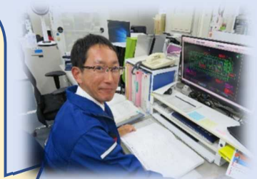
令和3年採用 一般職(大卒)土木

私は現在、警察活動で使用する電話、無線機等の情報通信システムの整備を担当しています。県警の担当者や部外の工事業者など、多くの人と協力して情報通信システムを作り上げる業務に、大変やりがいを感じています。大学では地球科学を専攻しており、情報通信の専門的知識がなく不安を感じていましたが、採用時に必要な教養を幅広く受けられるほか、所属に配属後も研修制度も充実しており、安心して働いています。情報通信システムは、警察活動の根幹を支える重要なものであり、それを整備・保守することは、やりがいのある仕事です。みなさんと一緒に働くことを楽しみにしています。