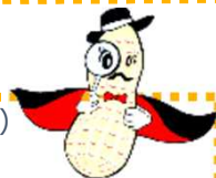
千葉地検広報キャラクター らっか正義君