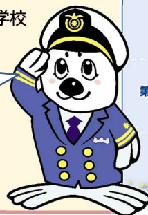
海上保安庁イメージキャラクター