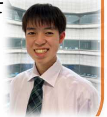
一般職（高卒） 令和5年度入省

失敗することもあります。先輩方に優しく教えていただきながら毎日楽しく働いています。