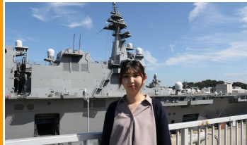
平成31年入省 一般職（高卒）技術 横須賀造船補給所 艦船部 電気科 大型艦電気係員