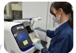
表示監視部 鑑定課 R2年採用 技術(化学)