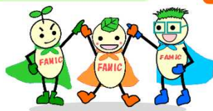
イメージキャラクター ファミ・アミ・ミック

〒330-9731 埼玉県さいたま市中央区新都心2-1 さいたま新都心合同庁舎検査棟 4階 総務部人事課人事第1係 TEL : 050-3797-1832 HP : http://www.famic.go.jp/