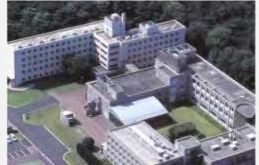
▲人事院公務員研修所(埼玉県入間市)