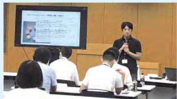
▲実務経験採用者研修の様子

各府省の民間企業等からの採用者を対象に、必要な知識や交流の場を提供するなど、公務員生活の開始を支援しています。