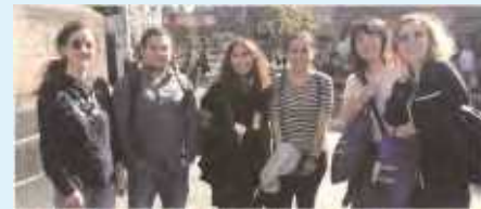
▲ザールラント大学(ドイツ)にて

派遣先：外国の大学院(修士課程・博士課程) 期間：2年又は1年(博士課程への進学の場合は延長可) (2022年度派遣実績)161人 米国89人、英国48人、フランス10人、オランダ4人、シンガポール4人、 ドイツ3人、スイス2人、中国1人