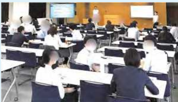
▲キャリア支援研修20(グループワーク)の様子

各府省の20代職員を対象に、自分のキャリアを主体的に考えるきっかけや新たな気づきを得る場を提供しています。