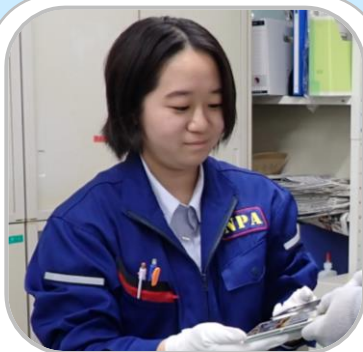
令和5年採用・技術系

無線や情報の専門知識がなくても、充実した研修と丁寧な指導を通して技術者として成長できます！