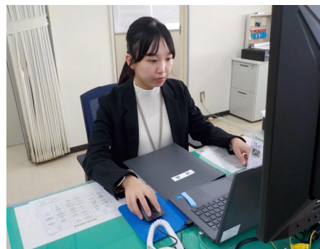
令和6年度採用(行政) 通信庶務課・経理係員