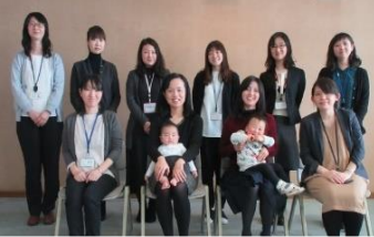
育休職員情報交換ワーキング