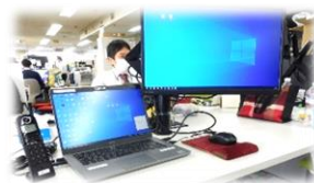
デスク周りの様子