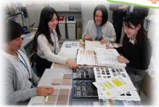
実際の業務の様子