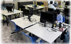
フリーアドレスでどの席でも仕事可能に