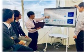
ICT技術を用いた会議