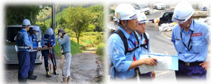
地元の方へ聞き取りの様子