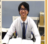
令和4年採用 一般職高卒（技術）男性

私は、自動車関係事業の安心・安全のために日々業務に取り組んでいます。貨物・旅客運送事業者や自動車整備事業者からの相談等、自動車に関する事業者と関わることで適正に事業を営めるようにしています。上司や先輩からのサポートや指導、各種研修を受けることにより自動車に関する業務の知識を身につけることができるので、安心して取り組むことができます。