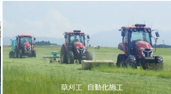
草刈工 自動化施工

01 滑走路、誘導路、エプロン及び構内道路の他、進入灯橋梁、共同溝及び貯水槽など、空港の地上・地下にある様々な土木施設が空港の機能を支えている。これらの施設が常に安全で円滑に機能するようきめ細やかな点検・維持管理を行っている。