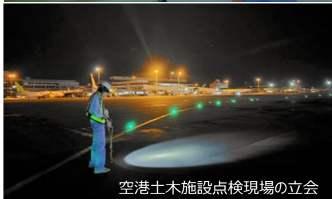
空港土木施設点検現場の立会

私は、那覇空港で空港機能の供用性、航空機の運航に対する安定性を確保するため、航空機の離発着に必要な基本施設（滑走路、誘導路、エプロンなど）をはじめとした空港土木施設の点検、維持、修繕を行っています。