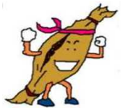
水戸地検広報 キャラクター わんなっちゃん