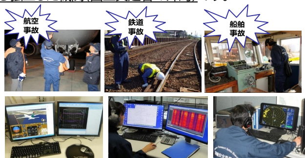
フライトレコーダーの解析

【公表】議決した報告書は、国土交通大臣へ提出するとともに、運輸安全委員会のホームページで公表します。また、必要があると認められるときは、 原因関係者へ改善を求めて勧告したり、関係行政機関に施策を提案する意見を述べたり する場合があります。この場合、関係者において改善施策や安全対策を実施し、運輸安全委員会へ講じた措置を報告する流れになります。