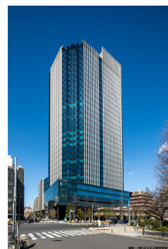
東京本部(四谷タワー)