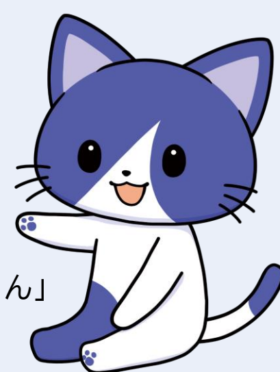
人事院職員採用公式キャラクター「ひとにゃん」