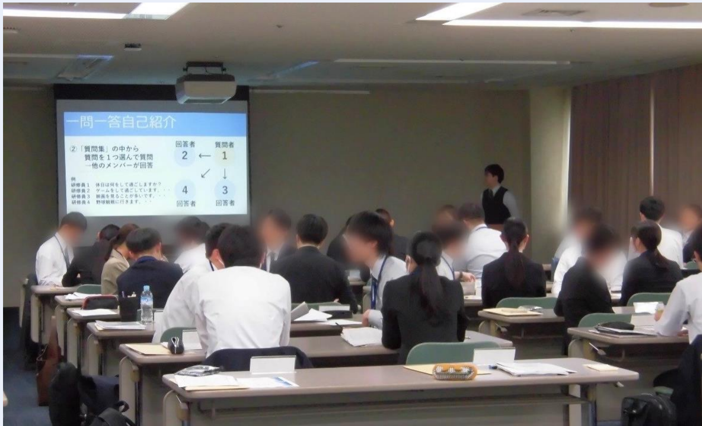
新採用職員研修実施の様子〈人事院職員が研修講師〉