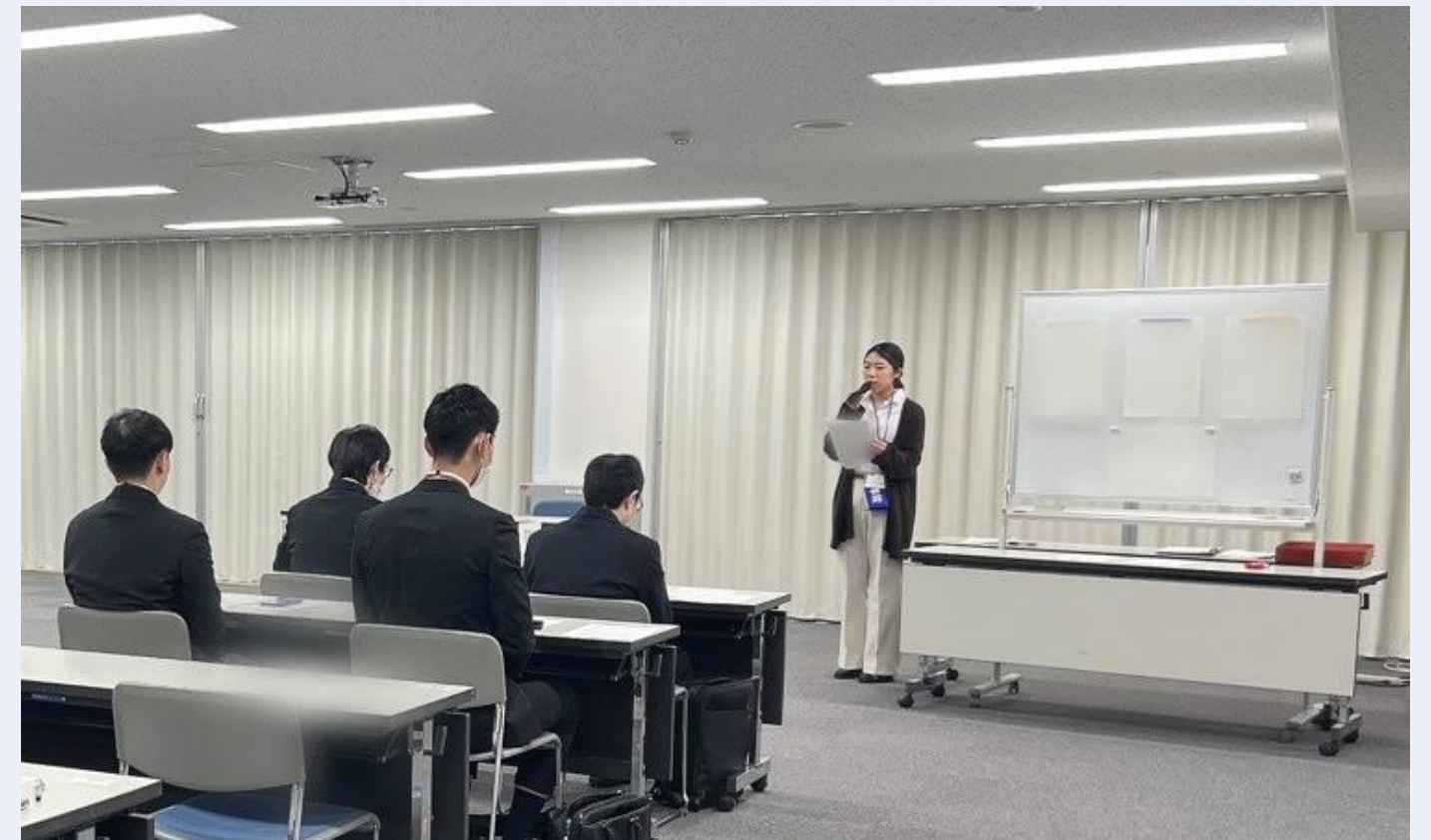
国家公務員採用試験（人物試験）実施の様子〈人事院職員が進行〉