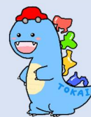
東海財務局公式キャラクター とうかいサウルス