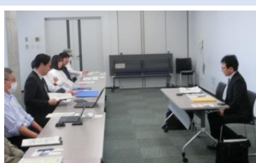
ヒアリング調査の様子