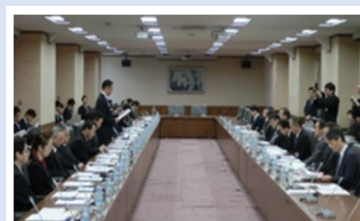
財務省での経済情勢報告

※もっと業務内容を知りたい方は、東海財務局 HP の「業務紹介パンフレット」をご覧ください。