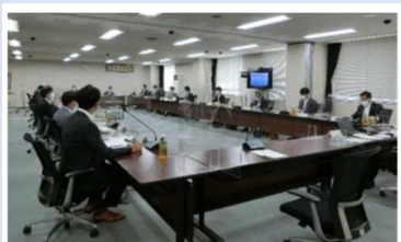
金融機関との会議の様子