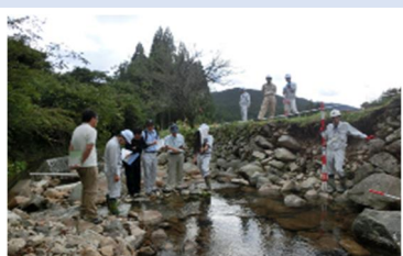
被災地の現地調査の様子