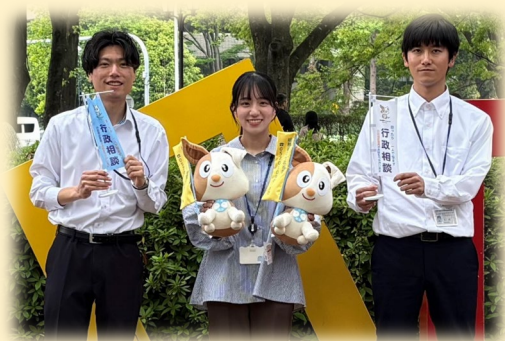
令和7年度採用（一般職大卒程度）

中部管区行政評価局の魅力は、若手職員が主体的に活躍できる点です。若手職員が発見した行政課題が調査テーマとして採用されることがあります。また、調査や相談から改善につなげることで、より多くの国民の豊かな暮らしに貢献できる点も魅力の一つです。