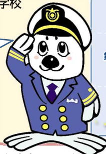
海上保安庁イメージキャラクター