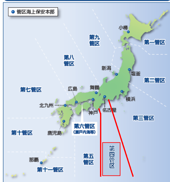
管区海上保安本部担任水域概略図