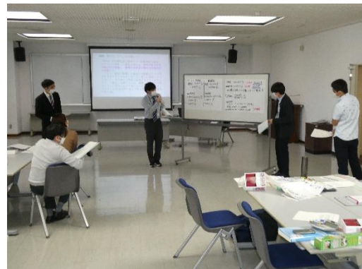
▲令和5年2月28日開催の様子