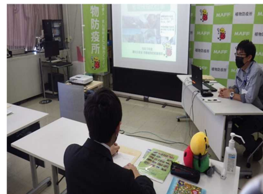
那覇植物防疫事務所