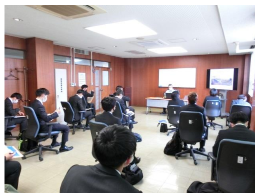
(個別ブースの様子)