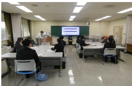
人事院沖縄事務所