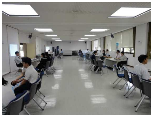
(個別ブースの様子)

人事院沖縄事務所 沖縄刑務所 福岡出入国在留管理局那覇支局 沖縄国税事務所 大阪航空局 第十一管区海上保安本部 沖縄气象台