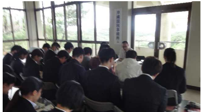
(個別ブースの様子)