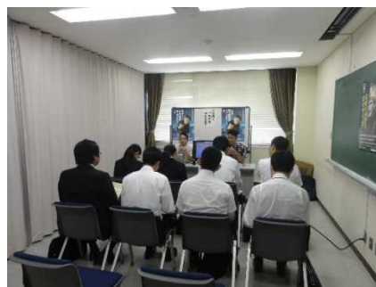
(各機関の説明の様子)