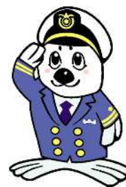
海上保安庁イメージキャラクター