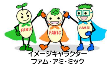
イメージキャラクター ファム・アミ・ミック

〒330-9731 埼玉県さいたま市中央区新都心2-1 さいたま新都心合同庁舎検査棟 4階 総務部人事課人事第1係 TEL : 050-3797-1832 HP : http://www.famic.go.jp/