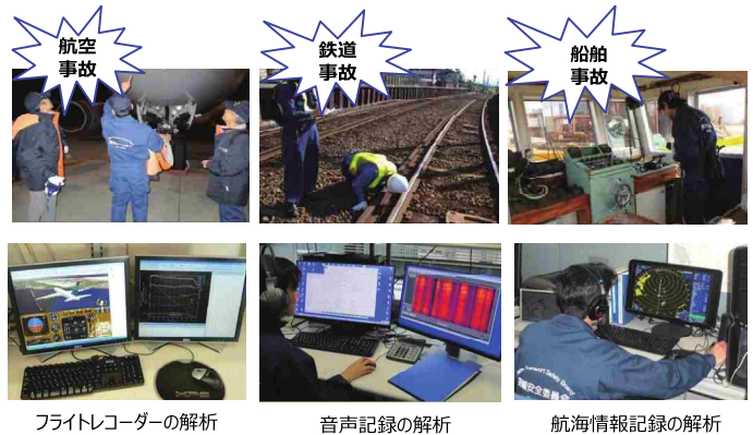
フライトレコーダーの解析

議決した報告書は、国土交通大臣へ提出するとともに、運輸安全委員会のホームページで公表します。また、必要があると認められるときは、原因関係者へ改善を求めて勧告したり、関係行政機関に施策を提案する意見を述べたりする場合があります。この場合、関係者において改善施策や安全対策を実施し、運輸安全委員会へ講じた措置を報告する流れになります。