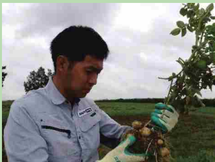
じゃがいもの根に寄生する病害虫の検査

キャリアパス：職員のスキルアップや業務に必要な知識を身に着けるため、様々な研修が実施されているほか、農林水産本省や試験研究機関との交流や海外で働く機会もあります。