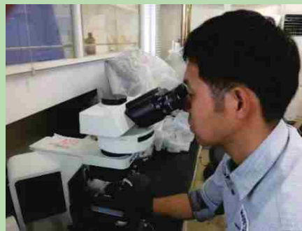
寄生していた病害虫の識別