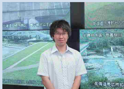
H30採用 一般職（大卒程度） 土木 <本局・河川計画課>

私は現在、北海道の一級水系を対象に今後の川づくりに関する検討に携わっています。今後30年間の川づくりのあり方について検討するため難しい内容が多いですが、上司や先輩方のサポートもあり、地域の暮らしの安全を守ることに携わっており、やりがいを感じています！