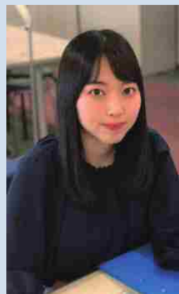
R4採用 一般職（大卒程度）行政 <旭川・経理課>

幅広い業務を通して生まれ育った大好きな北海道に貢献できる点に魅力を感じ入局を希望しました。