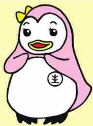
更生ペンギンのサラちゃん (更生保護のマスコットキャラクター)