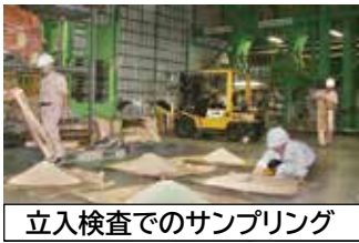
立入検査でのサンプリング