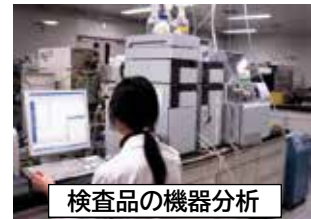
検査品の機器分析