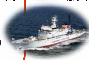
漁業取締船 白竜丸