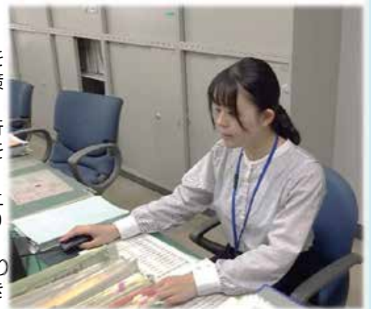
令和3年度一般職(大卒程度試験) [事務] 採用

北海道運輸局では幅広い業務を行っています。いずれもやりがいを感じられると思いますので、是非皆さんと共に仕事ができる日を楽しみにしています!