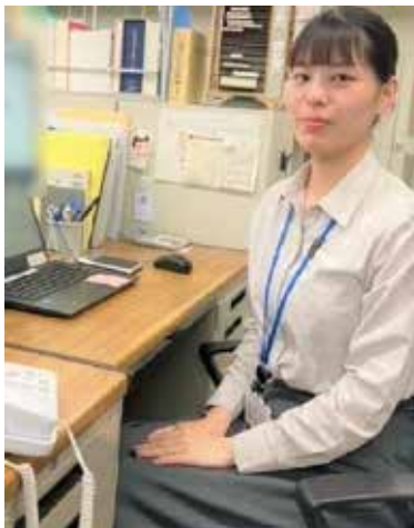
R5一般職（大卒程度）H・K

皆さんこんにちは!! 私は総務課係員として事務所の窓口業務をしているほか、庶務や会計事務、「こういう行為は独占禁止法上問題になるの?」といった相談への対応業務など様々な業務を行っております。特に相談への対応では、緊張もしますが非常にやりがいを感じます。私は一年目職員ですが上司の方々からサポートしていただきながら、幅広い業務に挑戦し、充実した楽しい毎日を送っています。公正取引委員会に興味のある皆さん、公正取引委員会の職員として是非一緒に働きませんか。