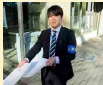
一般職行政区分 採用

最後になりますが、当事務局は少人数の職場のため若手のうちから課の垣根を越えて様々な業務で活躍することができます。少しでも人事院に興味を持った方は、下記QRコードからチェックしてみてください！