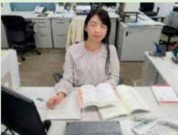
一般職行政区分 採用

次に試験係では、国家公務員採用試験の準備や実施などを行いました。試験をスムーズかつ正確に実施するために必要な確認作業や決まり事などがあり、試験の裏側ではこんな仕事をしていただんだ！という発見が多かったです。コロナの影響でイレギュラーなことも多々ありましたが、それぞれの試験を無事に終えたときは大きな達成感を得ることができました。