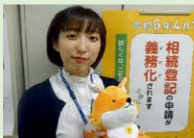
一般職行政区分 採用

私は採用されて2年目になります。採用当初から勤務している不動産登記部門では、登記申請の受付事務や審査事務を経験した後、現在は各種報告書の作成、登録免許税の還付手続、情報公開業務などを担当しています。臨機応変に対応しなければならず苦慮する場面もありますが、周囲の上司や先輩方からとても丁寧な指導を受け、業務を遂行することができ、自分の成長とやりがいを感じながら仕事に取り組んでいます。