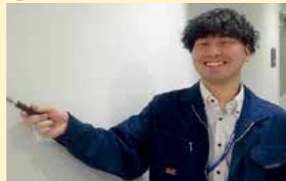
一般職行政区分 採用