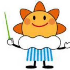
気象庁マスコットキャラクター 「はれるん」