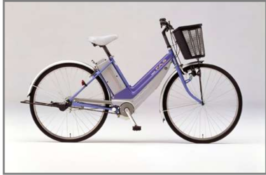
もっと手軽な乗り物を PAS 1993