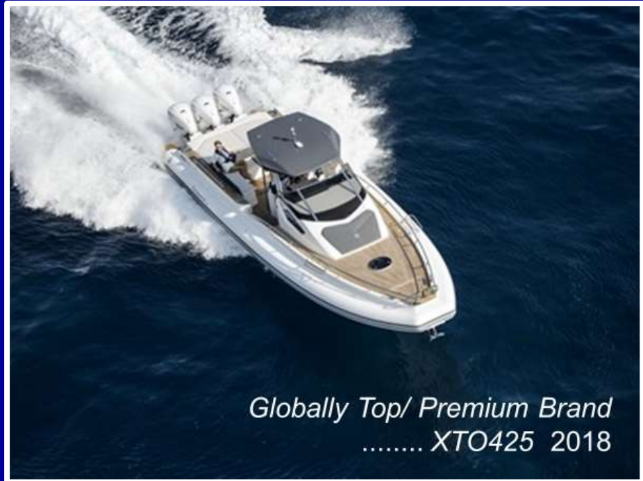
Globally Top/ Premium Brand ..... XTO425 2018