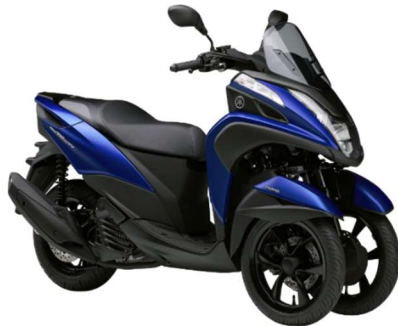
軽快感＋安定感 LMW 2014