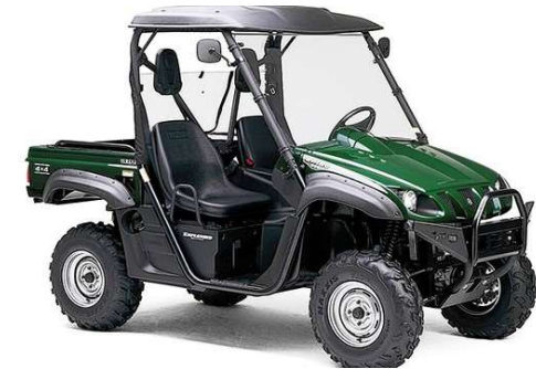
スポーツ・アドベンチャー ROV 2004