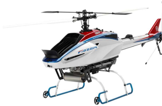
もっと効率的・精密な農業へ UMS 1987