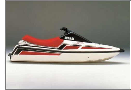
人機一体、水辺で手軽に PWC 1988