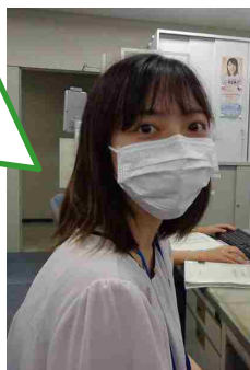
【R4採用 一般職(大卒程度) 行政】