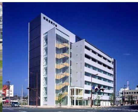
官庁施設整備事業