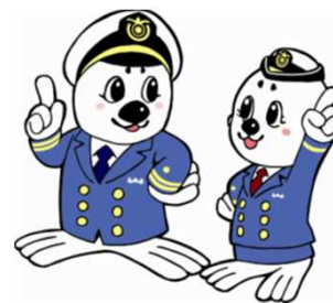
「うみまる」と「うーみん」