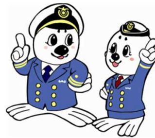
「うみまる」と「うーみん」