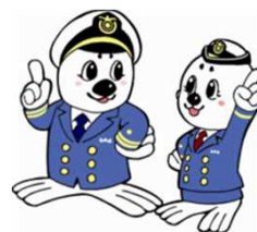
「うみまる」と「うーみん」