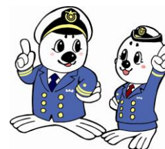
「うみまる」と「うーみん」