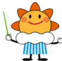
気象庁マスコットキャラクター 「はれるん」