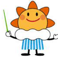
気象庁マスコットキャラクター 「はれるん」